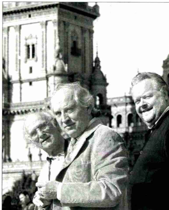
Carlos Saura, Vittorio Storaro y Michael Ecker en la plaza de España de Sevilla.