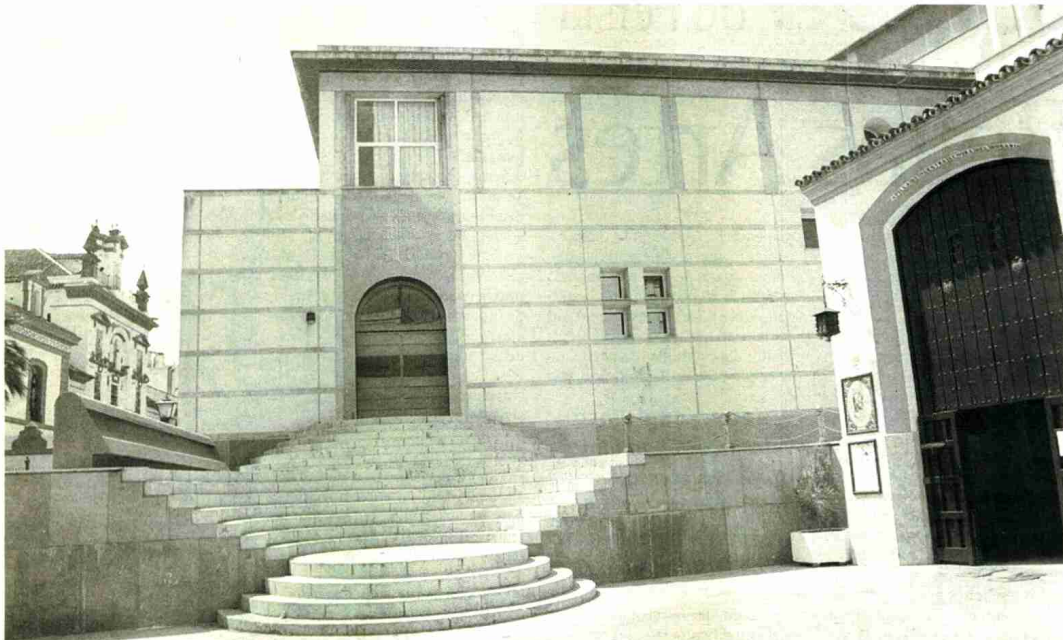
ANEXAS. Una de las dos salas del Arenal, en la que la empresa Opera on Original Site instalará su oficina de producción.